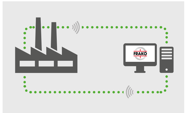
Bidirektionale Kommunikation zwischen Kundenanlage und FRAKO SupervisionService

Durch die bedarfsorientierte Wartung entsteht kein unnötiger Zeitaufwand für Ihr Personal und Sie müssen kein spezielles Know-how mehr vorhalten, sondern können sich in aller Ruhe auf Ihr Kerngeschäft konzentrieren. Eventuell benötigtes Material wird ermittelt, passend geliefert und von FRAKO Spezialisten oder in Zusammenarbeit mit Ihren Fachleuten vor Ort eingebaut.